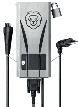
Die Abbildung zeigt eine vollständig montierte Ansicht des LiON Smart Chargers im Lion Wall unter der Verwendung des LiON Locks!