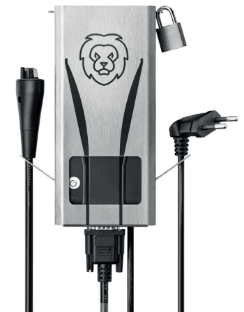
The illustration shows a fully assembled view of the LiON Smart Charger in the Lion Wall by using the LiON Lock!